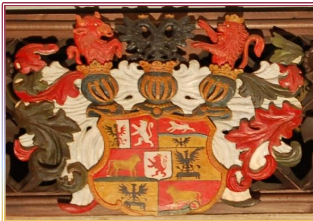
Erb Auerspergů v bývalé Carlosově ložnici.