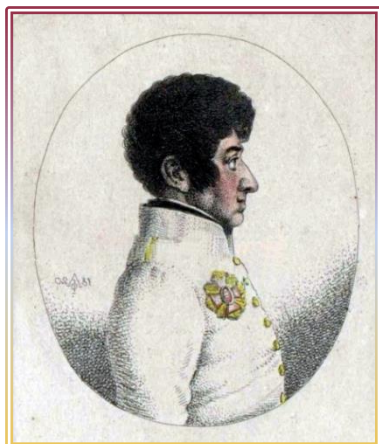
Vilém I. Auersperg